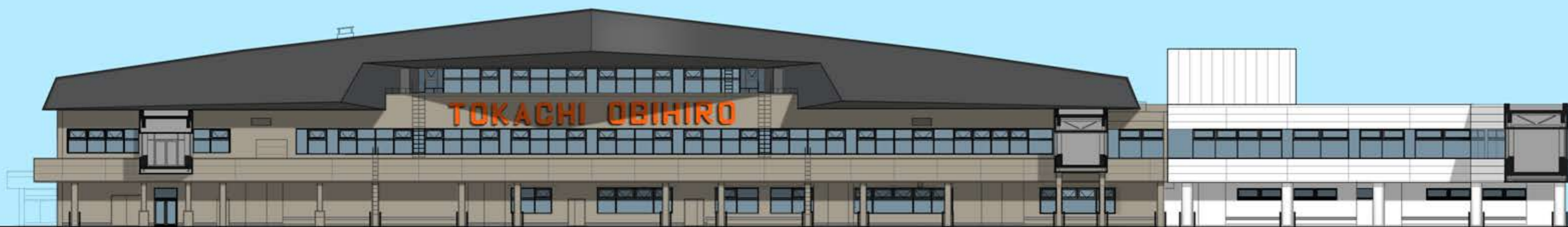
東側立面図(エプロン側)