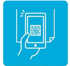
北海道コロナ通知システムと 接触確認アプリ(COCoA)を 活用しよう