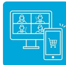
オンラインを 上手に使う