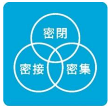
3つの「密」を さけよう