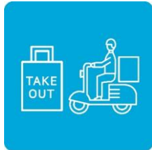
テイクアウトや デリバリーも